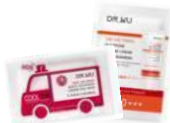
舒緩補水冰晶凍膜-5g 極效全能防曬霜-2ml