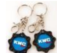
精美鏈條鑰匙圈 乙只